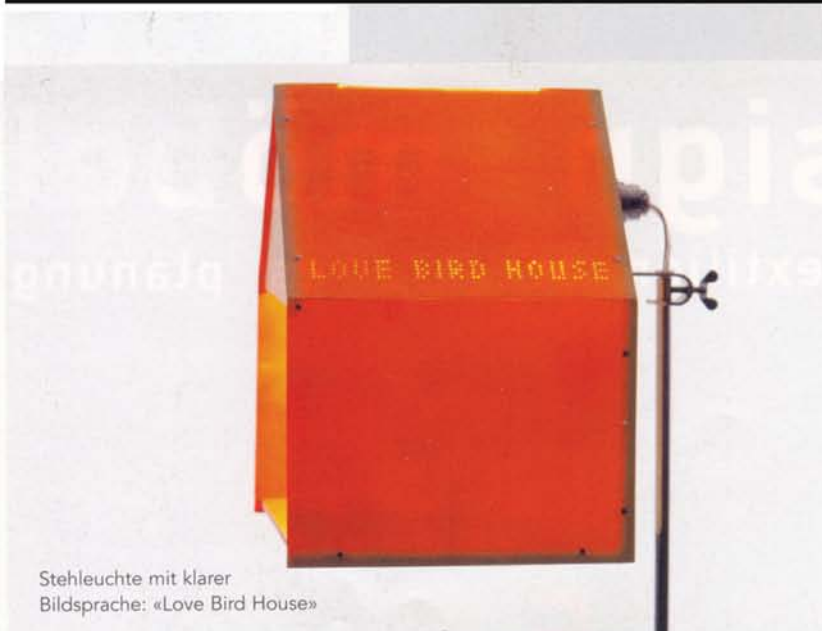
Stehleuchte mit klarer Bildsprache: «Love Bird House»

Tel. 01 241 47 05, hello@sabineleuthold.com