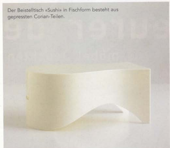
Der Beistelltisch «Sushi» in Fischform besteht aus gepressten Corian-Teilen.